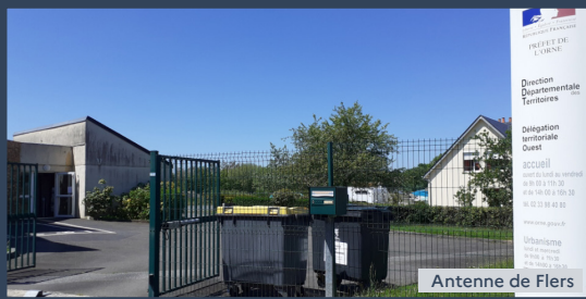
Antenne de Flers