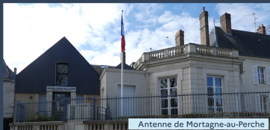
Antenne de Mortagne-au-Perche