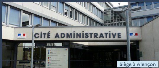
Siège à Alençon